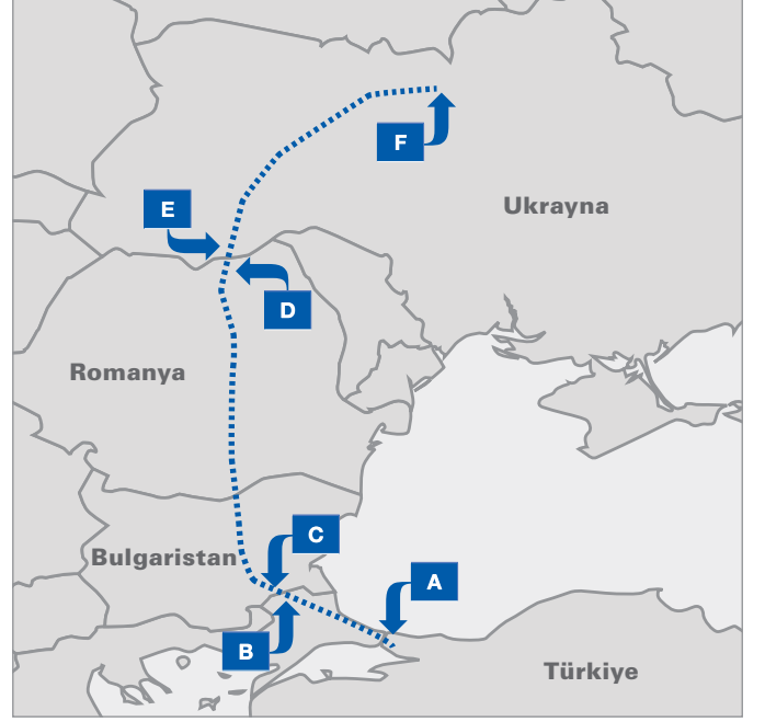
Bu harita, TIR karnesi kapsamında gerçekleştirilen taşımaya bir örnektir

Broşürün sol tarafında her bölümün usulüne uygun olarak doldurulmuş bir örneğini görebilirsiniz. Alanların kim tarafından doldurduğunu göstermek amacıyla boşluklar farklı renklerle kodlanmıştır. Kişilerin rollerini daha iyi göstermek amacıyla, bir hareket ve bir varış Gümrük idaresini kapsayan basit bir taşıma örneği sunulmuştur.