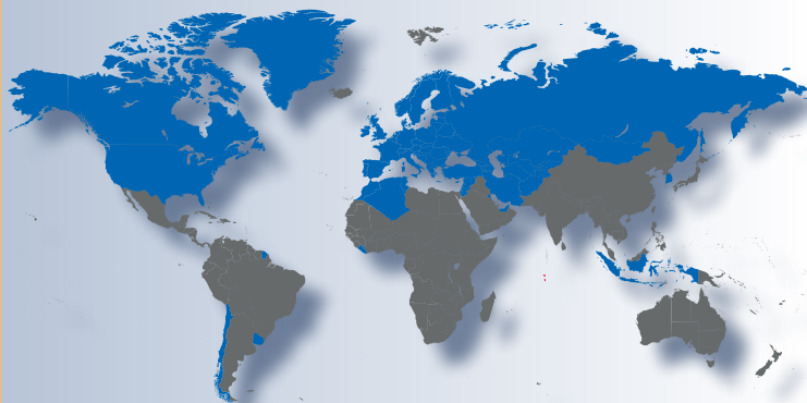
Parties contractantes TIR en 2011

Le nombre de Carnets TIR émis chaque année n'a cessé de croître au fil des ans. Compte tenu de la hausse prévue des volumes commercialisés au niveau international, le Régime TIR est destiné à jouer un rôle toujours plus crucial en matière de promotion, de sécurisation et de facilitation du commerce et du transport routier international.