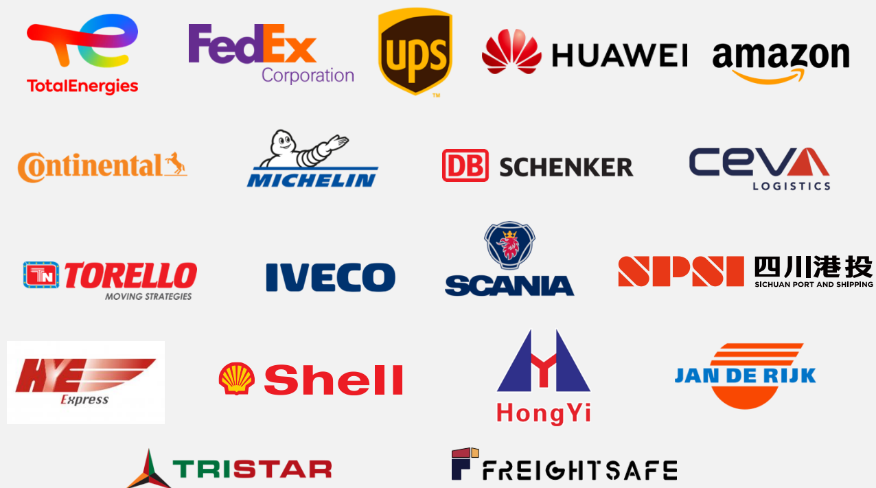
IRU部分企业会员展示